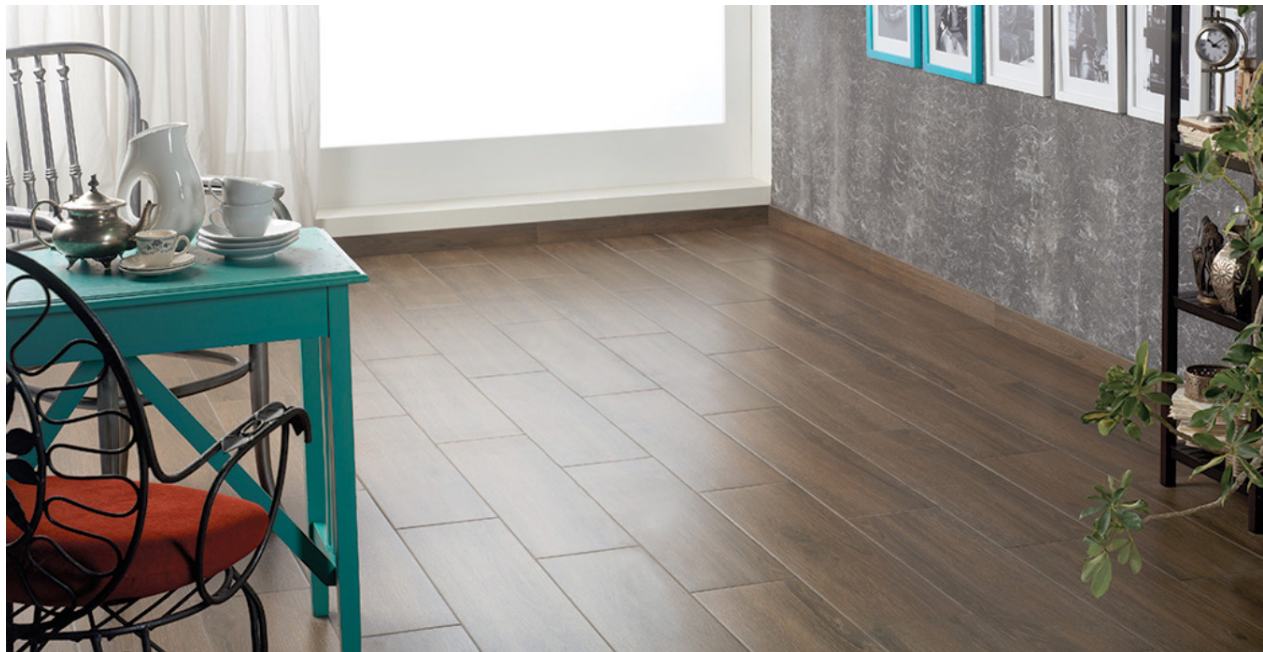
Figura 1. Producto instalado

En este estudio de ACV de la cuna a la puerta, se ha aplicado un criterio de corte de 1% para el uso de energía (renovable y no renovable) y el 1% de la masa total en aquellos procesos unitarios cuyos datos son insuficientes. En total, se ha incluido más del 95% de todas las entradas y salidas de materia y energía del sistema, excluyendo aquellos datos no disponibles o no cuantificados.